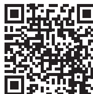
Video - Výměna kartuše u baterie